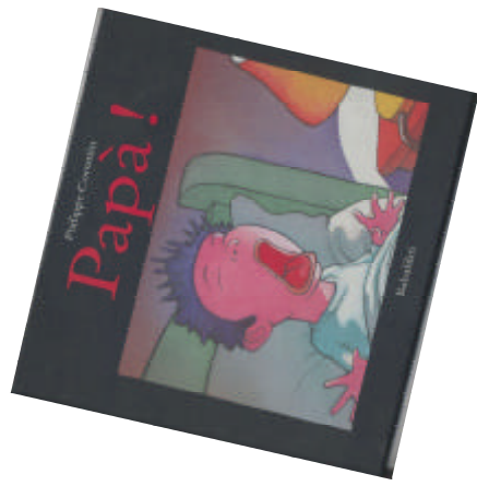
Papà! di Philippe Corentin Babalibri, 1999 NPL COR PAP