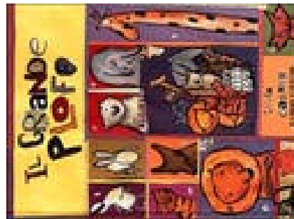
Il grande Ploff: da una leggenda dell'Hi malaya di Chiara Carneri Fabbri, 1999 NPL CAR GRA