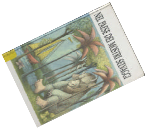
Nel paese dei mostri selvaggi storia e illustrazioni di Maurice Sendak Babalibri, 1999 NPL SEN NEL