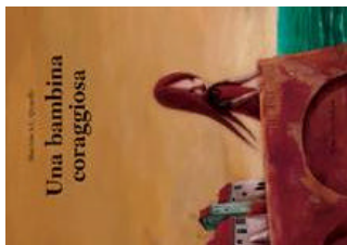
Una bambina coraggiosa di Maurizio A.C. Quarello e Alfredo Stoppa; illustrato da Maurizio A.C. Quarello Bohem, 2006 NPL QUA BAM