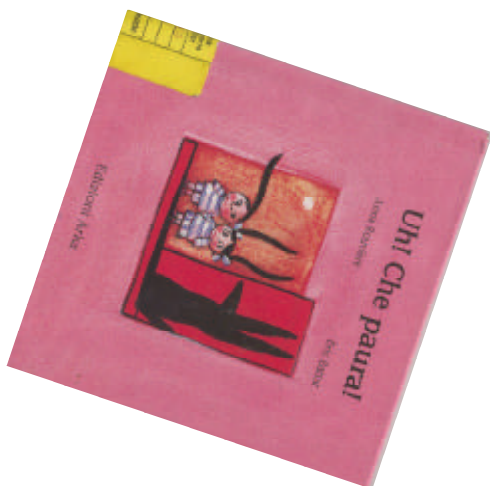
Uhi Che paura! di Anna Rouviere; illustrato da Eric Battut Arka, 2000 NPL ROU UHC