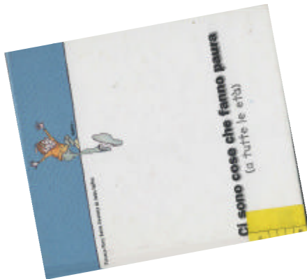
Ci sono cose che fanno paura di Florence Parry Heide; illustrato da Jules Feiffer Ape, 2003 NPL HEI CIS