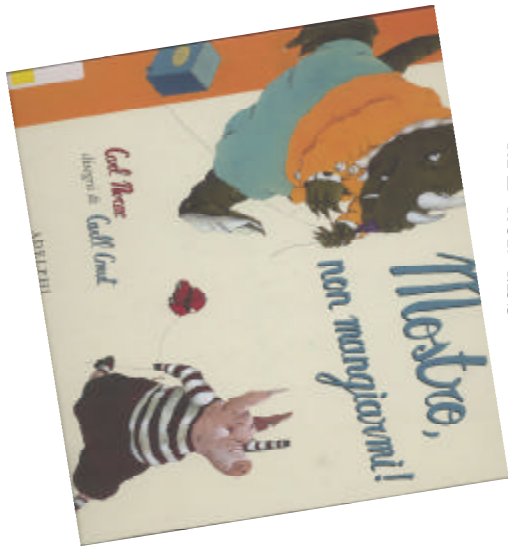
Mostro, non mangiarci! di Carl Norac; illustrato da Carli Cneut Adelphi, 2006 NPL NOR MDS